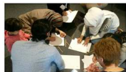
Halbtagesseminar für Lehrkräfte in Sprach- und Integrationskursen