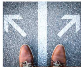
Herausforderung (Schein-) Selbständigkeit Die Beurteilung des sozialversicherungsrechtlichen Status von Honorar-Lehrkräften in der Integrationskursarbeit